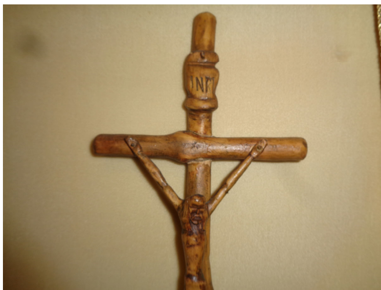
2. La cruz de Táchira