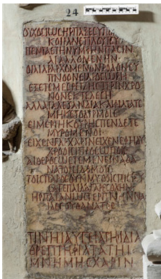
Il. 10. Stela nagrobna, 251-350 r., Muzea Watykańskie, fot. za: https://catalogo.museivaticani.va/index.php/Detail/objects/MV.9037.0.0 .