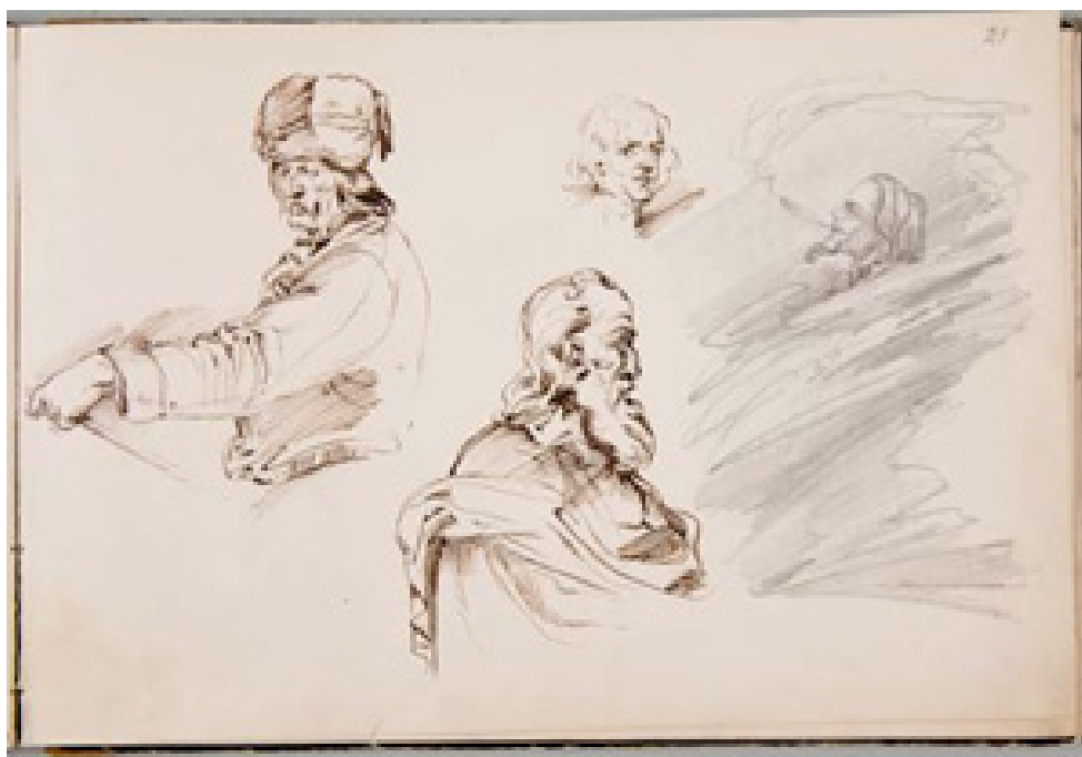
Il. 6. C. Norwid, Autoportret z papierosem i inne szkice , 1846, tusz, pióro, ołówek, w: C. Norwid, Album berliński , Muzeum Narodowe w Warszawie, fot. Muzeum Narodowe w Warszawie.

łatwiejszego rysowania – w lewo 9 . Warto przypomnieć, że Norwid nie zdobył pełnego artystycznego wykształcenia, w związku z czym borykał się z problemami związanymi z anatomią, także z perspektywą oraz z kompozycją scen wielofiguranych. Jego twórczość zdominowały drobne rysunki oraz akwarele, przedstawiające głównie pojedyncze sylwetki, popiersia oraz głowy, nierzadko zestawiane swobodnie na kartach szkicowników czy luźnych arkuszach papieru. O ile rzadził sobie doskonale z odtwarzaniem ludzkich fizjonomii, o tyle znacznie mniej sprawnie przedstawiał inne partie ciała, stąd zauważalna w jego spuściźnie rysunkowej predylekcja do powtarzania pewnych utrwalonych póz i gestów.