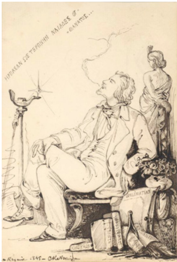
Il. 1. C. Norwid, Autoportret z grecką inskrypcją , 1845, pióro, tusz, fot. E. Chlebowska.

W lewym dolnym rogu, przy krawędzi rysunku sygnatura artysty wpisana drobnym pismem: „w Rzymie 1845 r. CKNorwid”.