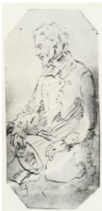
Il. 4. C. Norwid, Autoportret ze skrzyżowanymi rękami , ok. 1852, zag..