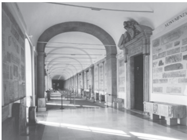
Il. 11. Galleria Lapidaria, Muzea Watykańskie, fot. za: https://www.museivaticani.va/content/museivaticani/en/collezioni/musei/galleria-lapidaria/galleria-lapidaria.html .

Wątpliwe, by źródłem Norwidowskiego cytatu mógł być sam artefakt, czyli marmurowa stela pokryta inskrypcją, datowana na lata 251-350 r. n.e. 16