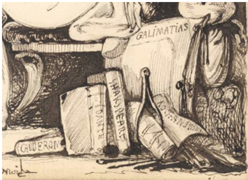
Il. 2. C. Norwid, Autoportret z grecką inskrypcją, 1845, fragment