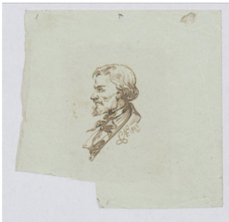
Il.3. C. Norwid, Autoportret rzymski I , 1847, tusz, pióro, Biblioteka Jagiellońska, fot. Biblioteka Jagiellońska.

mentaryczne, jak i całopostaciowe ujęcia, łączy z pierwszym wizerunkiem kame-ralna, rysunkowa forma oraz prezentacja lewego profilu, różni natomiast większa swoboda oraz pewność artystycznego gestu 4 . Swą podobiznę Norwid umieszczał wśród innych rysunków na kartach szkicowników lub na przygodnych kartkach papieru. Dość powiedzieć, że jeden z bardziej reprezentacyjnych autoportretów, ujęty w elegancko kreśloną, dekoracyjną formę Autoportret rzymski I , z podkreśloną bródką i fantazyjnie zawiązaną chustką krawatową, powstał na oddartym z większego arkusza nieregularnym skrawku papieru (il. 3) 5 .