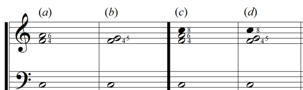
Przykład 5. Sposób traktowania interwału kwarty jako konsonans ( a, c ) i dysonans ( b, d )

z nią pojawi się seksta (przykład 5, a ), jednak w obecności kwinty jest już ona dysonansem (przykład 5, b ). W tym przypadku wymagane było rozwiązanie tego interwału na konsonans. Dodanie, czyli zdwojenie oktawy w obu tych przypadkach nie zmienia jej charakteru (przykład 5, c i d ).