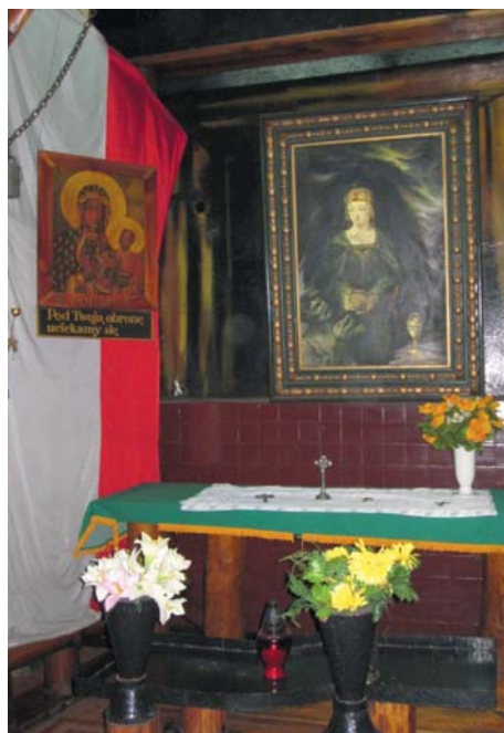
Fot. 1. Ołtarz św. Barbary w zlikwidowanej kopalni „Nowy Wirek” (2010 r.)

przed udaniem się do pracy wspólnie modlitwy odmawiają; gdy górnicy zmieniają się rano i wieczór skoro 12 godzinnymi szychdami robią, a zaś trzy razy dziennie gdy tylko 8 godzinnymi pracują [...] przeto odmawiają nabożeństwa ranne, południowe i wieczorne, z tych zwykle w południe najkrótsze. Litanije do S. Barbary, do SS. Aniołów Stróżów prócz właściwych do pory dnia modlitw, najczęściej są odmawiane” (Łabęcki, 1842, s. 151-152).