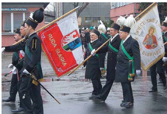
Fot. 6. Przemarsz górników z cechowni kopalni „Halemba” do kościoła (4.12.2012 r.,)