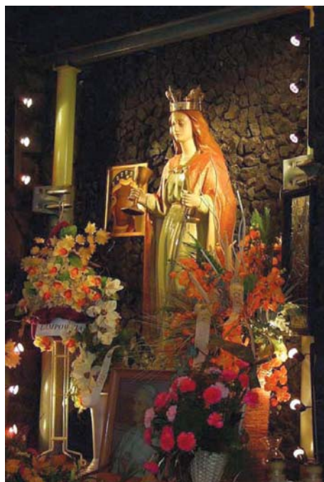
Fot. 2. Figura św. Barbary w cechowni kopalni „Halemba” (2012 r.)

(Ligęza, Żywirska, 1964, s. 169-170). Po drugiej wojnie światowej losy wizerunków św. Barbary w cechowniach stały się niewygodne dla ówczesnej władzy komunistycznej, były bowiem w sprzeczności z propagowaną ideologią świeckości państwa, stąd od 1948 roku nakazano ich usuwanie. Po 1956 roku znów „na krótko” pojawiły się w kopalniach, by w latach 70. ostatecznie zniknąć (Myszor, 1993). Przed zniszczeniem wielu tych obiektów kultu uchroniła je postawa górników, którzy w tajemnicy, pod groźbą represji ze strony służb bezpieczeństwa, ukrywali je lub też oddawali „na przechowanie” do kościołów czy muzeów (Bukowska-Floreńska, 2007, s. 177). Powrót wizerunków św. Barbary do kopalń w latach 80. był wyrazem determinacji środowiska górniczego i miał on „bezpośredni związek ze strajkami górników na przełomie sierpnia i września 1980 roku. Żądania przywrócenia usuniętych obiektów kultu stanowiły w wielu zakładach część postulatów strajkowych” [Piecha-van Schagen, 2018, s. 614]. Jeśli niemożliwa była impostacja przedstawień patronki we wspomnianych cechowniach, wówczas wznoszono ku jej czci kapliczki na terenie kopalń czy miejscowości (np. w Zabrze, Rudzie