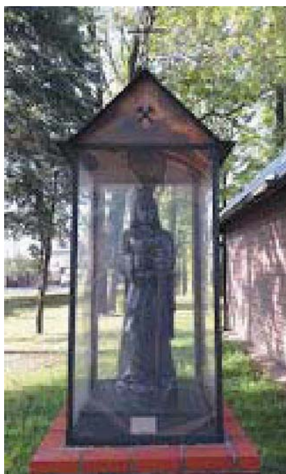
Fot. 5. Rzeźba św. Barbary z węgla przy kościele parafialnym w Ornontowicach (2018 r.)