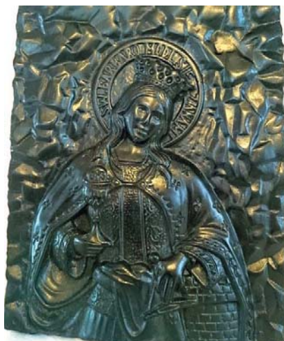
Fot. 4. Płaskorzeźba z węgla przedstawiająca św. Barbarę