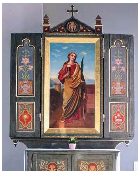
Fot. 3. Ołtarz św. Barbary w kaplicy pod jej wezwaniem (przy centrum handlowym Silesia City Center w Katowicach, 2018 r.)

Barbaro, aby nic mu się złego nie przytrafiło” [zapis. w Rudzie Śląskiej-Bieloszowicach w 2012 r.], „Święta Barbaro, wejrzyj na mnie na dole” [zapis. w Mikołowie w 2013 r.]. W każdej też rodzinie górniczej znajdują się wizerunki patronki górniczego stanu, często wykonane z węgla (figurki, płaskorzeźby, zob. fot. 4-5), górnicy noszą przy sobie także poświęcone medaliki z jej obliczem. Stosunkowo nową formą są tatuaże przedstawiające św. Barbarę (również symbole górnicze, szyby kopalniane itp.), którymi górnicy ozdabiają swoje ciała, traktując je jak swego rodzaju amulety ochraniające ich przed wypadkami pod ziemią 4 .