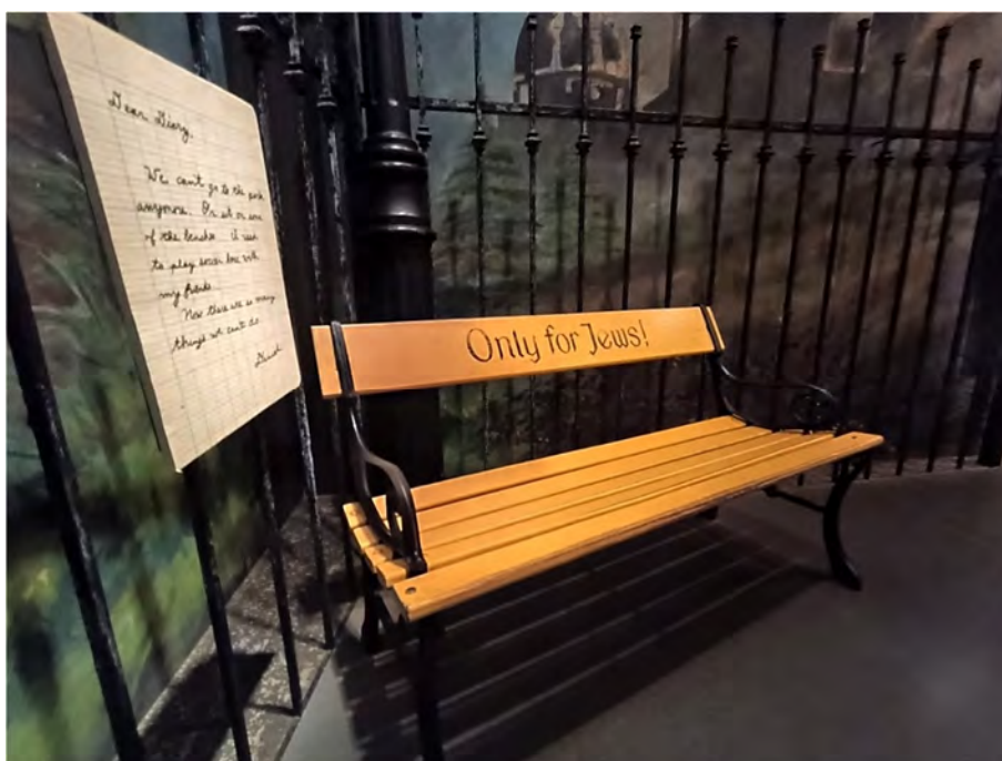
Fot. 4. Ławka „tylko dla Żydów”. Daniel’s Story – USHMM.

Także w kolejnych przestrzeniach ekspozycji wykorzystano realne przedmioty wspierające narrację wystawy. To na przykład tort i strudel w witrynie cukierni, ławka parkowa przeznaczona „tylko dla Żydów” (fot. 4), zniszczone okna wystawowe rodzinnego sklepu żydowskiego, w które rzucono kamieniem (który też jest elementem ekspozycji). W tym miejscu można włożyć rękę przez otwór wybity w szybie albo dotknąć jej fragmentów, które pozostały w witrynie (są oszlifowane tak, by były bezpieczne dla zwiedzających).