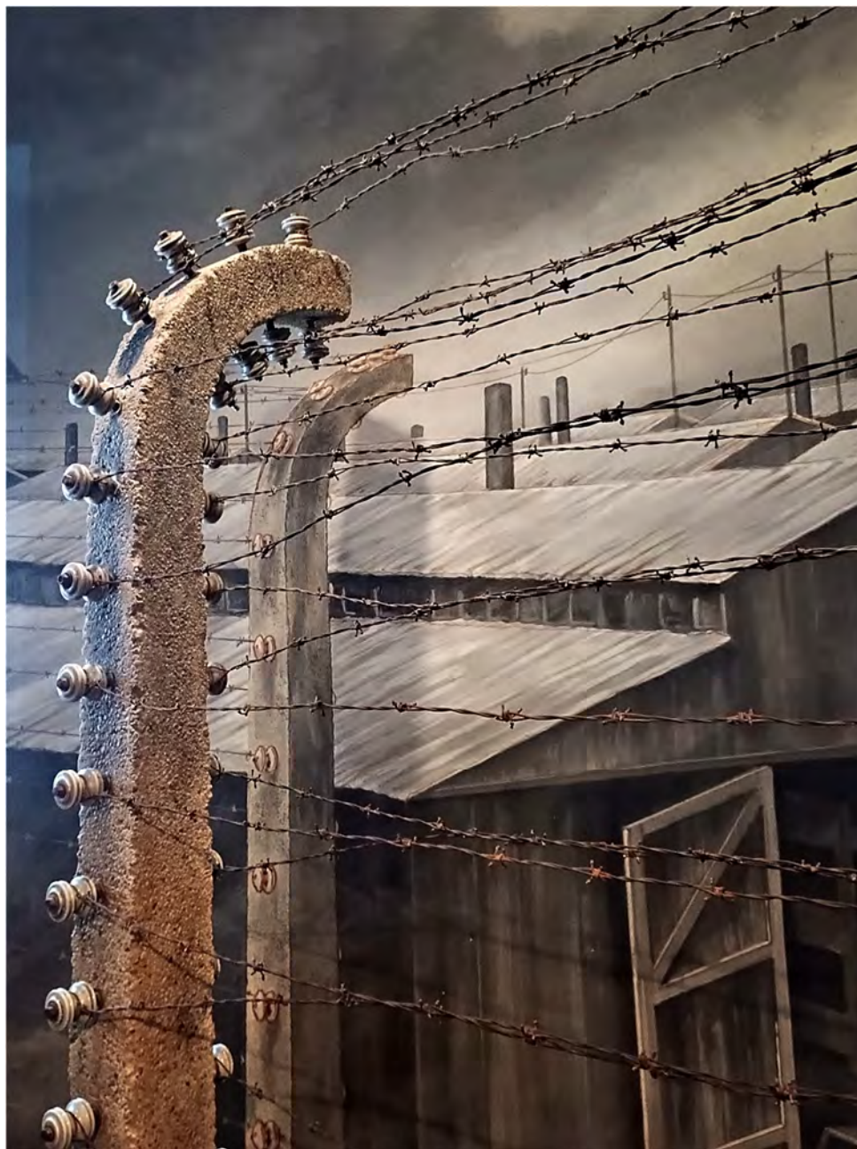
Fot. 6. Za drutami Auschwitz . Daniel's Story – USHMM.