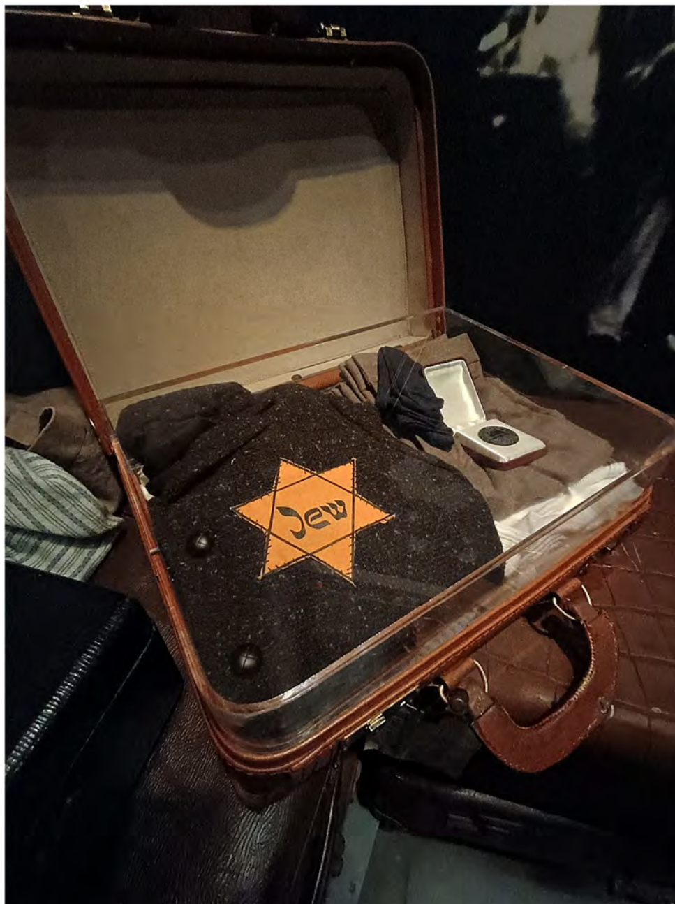
Fot. 5. Żółta gwiazda . Daniel's Story – USHMM.