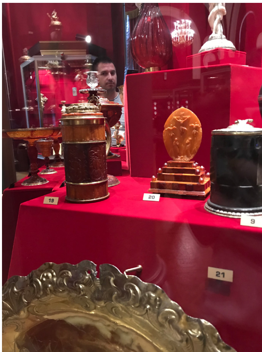
Il. 4. Kufel, pierwsza połowa XVII wieku, bursztyn, srebro; wys. 23 cm; Wyobrażenie Ukrzyżowania , bursztyn, kość słoniowa, drewno, aksamit, wys. 20,5 cm; kielich, Koenigsberg (?), bursztyn, srebro, wys. 11 cm – wszystkie eksponaty Zbrojownia, Muzeum Moskiewskiego Kremla; fot. Marta Król