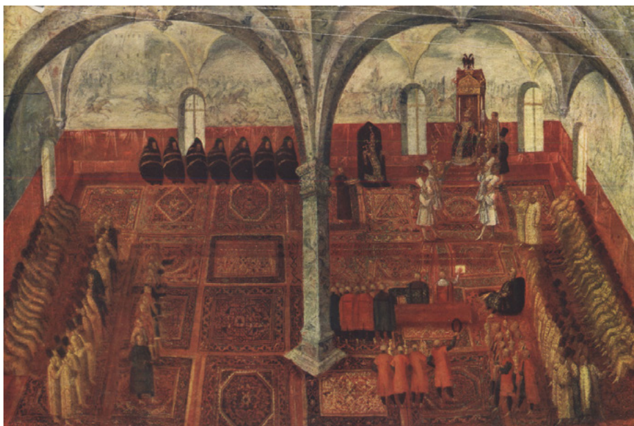
Il. 10. Obraz Przyjęcie posłów polskich przez Dimitra Samozwańca I w Granowitoy Palacie 2 (13) maja 1606 roku , 45x66 cm, Państwowe Muzeum Historyczne w Moskwie