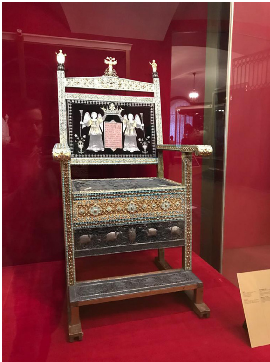
Il. 6. Diamentowy tron Aleksieja Michajłowicza, Arsenal, Muzeum Moskiewskiego Kremla