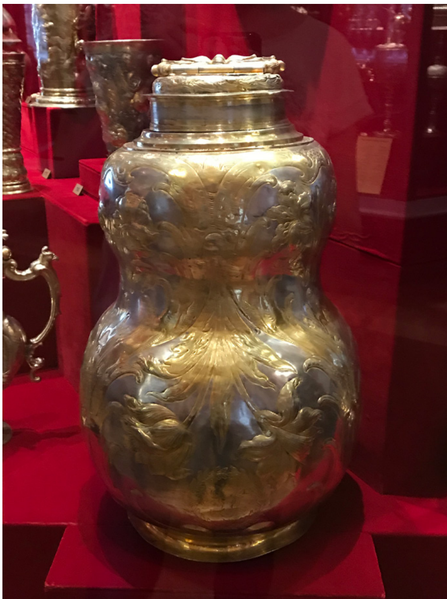
Il. 1. Flaszka, mistrz monogramista H/PL, Gdańsk, dar poselski Stanisława Kazimierza Bieniewskiego dla cara Aleksieja Michajłowicza z 1667 roku, Zbrojownia, Muzeum Moskiewskiego Kremla