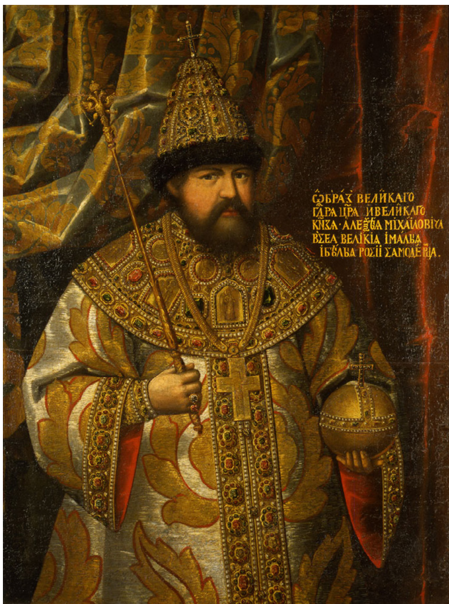
Il. 7. NN. Portret cara Aleksieja Michajłowicza, olej na płótnie, Państwowe Muzeum Historyczne w Moskwie