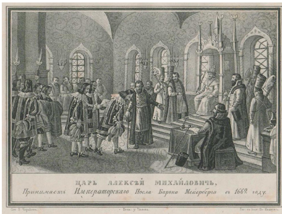
Il. 5. Car Aleksiej Michajłowicz przyjmujący posła barona Mayerberga w 1662 roku, reprod. za: Karamazin. Zhivopisnyu Karamzin [Карамзин. Живописный Карамзин ]