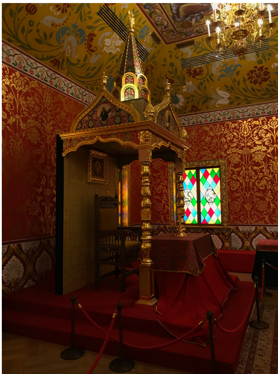
Il. 9. Baldachim nad tronem carskim, rekonstrukcja, Kołomienskoje [Коломенское], zespół muzealno-architektoniczny na obrzeżach Moskwy