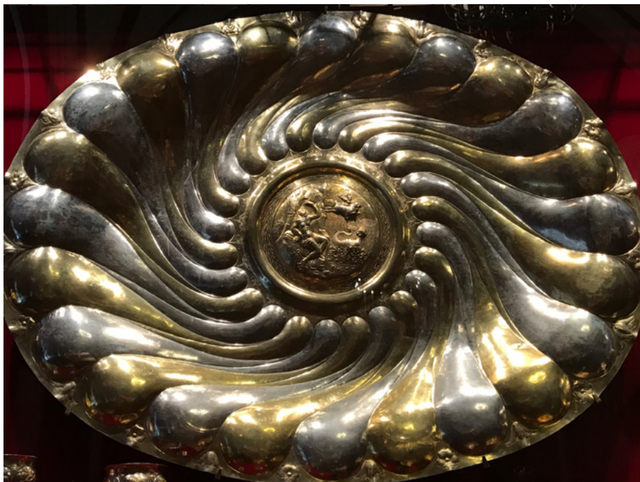
Il. 3. Misa z kompletu do mycia rąk, mistrz monogramista P/HL, Gdańsk, druga połowa XVII wieku, dar Jana Kazimierza dla cara Aleksieja Michajłowicza z 1667 roku, Zbrojownia, Muzeum Moskiewskiego Kremla