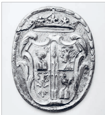
Ryc. 5. Rewers medalu Gaspara Morone z trawestowanym herbem rodu Chigi 33

Jakkolwiek herb papieski występuje na ogół w niezmienionej postaci, można odnaleźć także wersje zbliżone do wzoru zamieszczonego w Speculum . Metropolitan Museum of Art posiada w swoich zasobach medal bity za pontyfikatu Aleksandra VII. Gasparo Marone zamieścił na awersie wizerunek papieża, na rewersie z kolei jego rodowe godło, które w tym wypadku znacznie odbiega od pierwotnego.