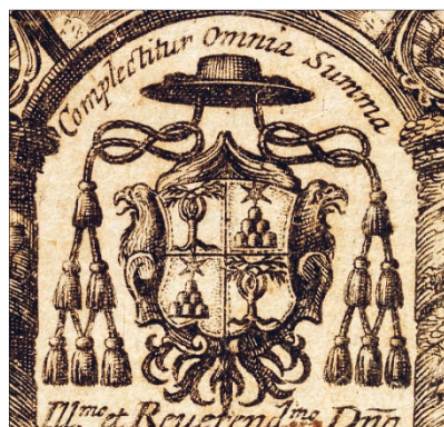
Ryc. 4. Herb Fabiusza Chigiego w książce Jakuba Masena

Co istotne, spośród czterech elementów, jakie Jakub Masen uczynił kanwą opracowanych przez siebie utworów, rodowe godło w klasycznej wersji posiada tylko trzy. Na próżno doszukiwać się na nim wizerunku orła, którego na rycinie w Speculum veritatis occultae wprowadzono w miejsce labrów 31 .