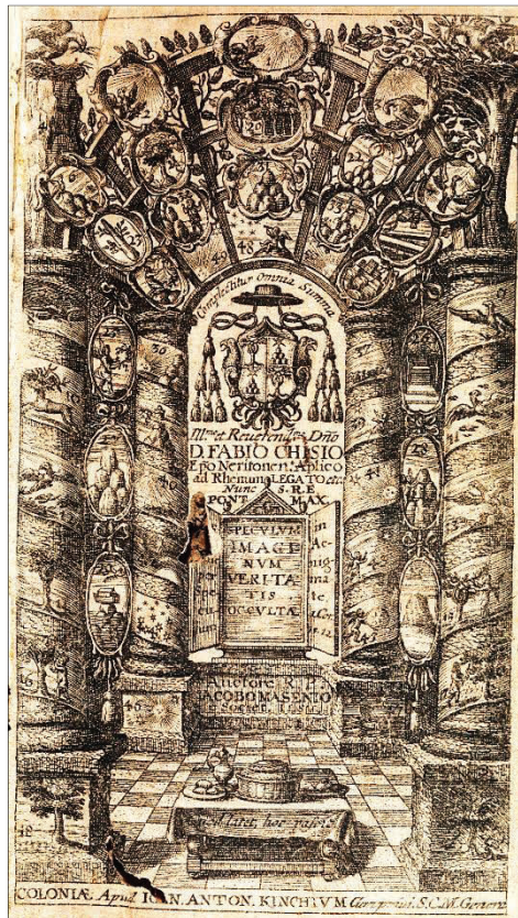
Ryc. 1. Rycina poprzedzająca stronę tytułową w edycji z 1664 r. 27

Na cokole podtrzymującym całość umieszczono imię i nazwisko autora z zaznaczeniem, że to jezuita, a jeszcze niżej rok wydania dzieła 26 . U dołu przedstawienia znajduje się z kolei niewielki stół, na którym stoją naczynia i potrawy, a na obrusie frontem do czytelnika zapisano dewizę: „Quod latet, hoc pascit” („To, co ukryte, karmi”).