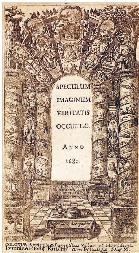
Ryc. 2. Chalkografia zamieszczona w wydaniu z 1681 r. 28

zmian również po śmierci papieża Aleksandra VII, gdy z centrum grafiki usunięto jego herb i towarzyszącą mu dedykację oraz – najprawdopodobniej ze względów technicznych – także wizerunek osadzonego w tryptyku lustra (Ryc. 2).