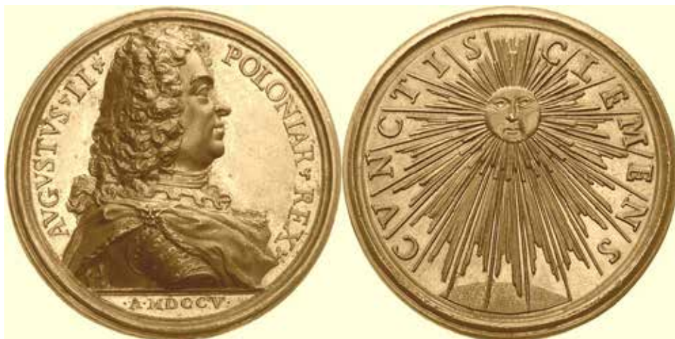
Il. 5. Medal Augusta II z 1704 r. (za: Raczyński, Gabinet medalów polskich )