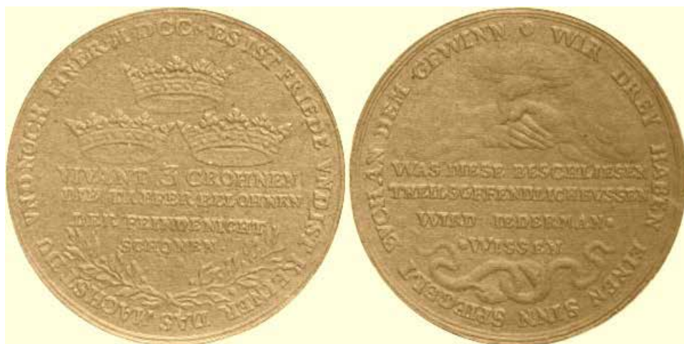
Il. 3. Medal szyderyczy z ok. 1700 r. (za: Raczyński, Gabinet medalów polskich )