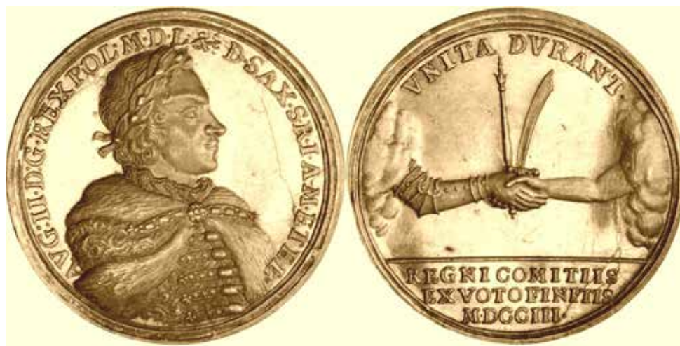
Il. 4. Medal wybity z okazji sejmu lubelskiego z 1703 r. (za: Raczyński, Gabinet medalów polskich )