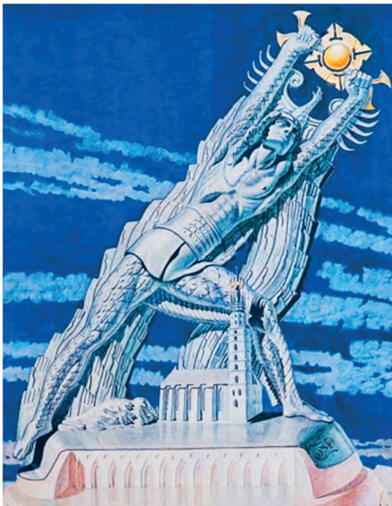
4. Stanisław Szukalski, szkic projektu pomnika Kopemika, 1970