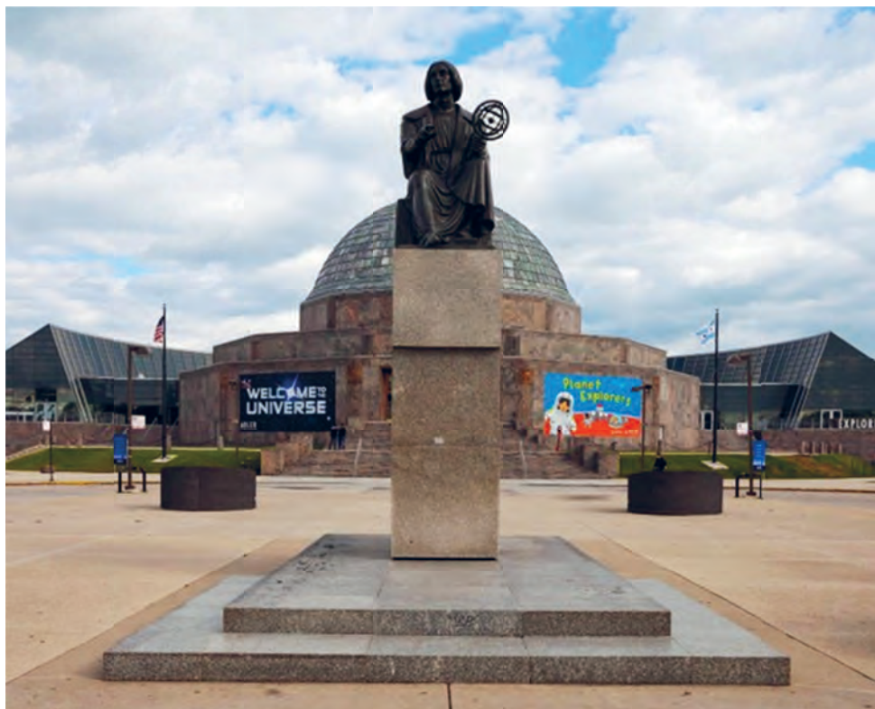
5. Kopia rzeźby Mikołaja Kopernika autorstwa Bertela Thorvaldsena wykonana przez Bronisława Koniuszego, Chicago 1973, USA