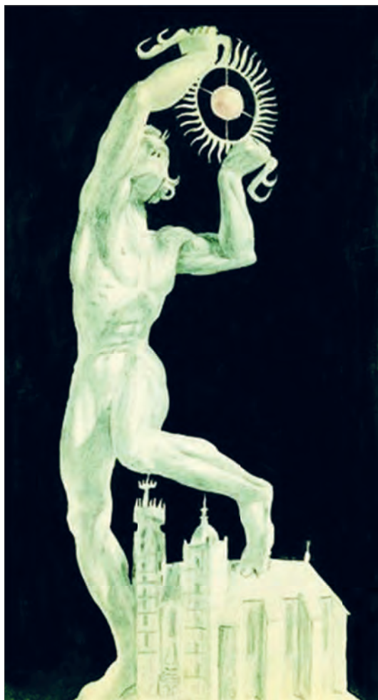
3, Stanisław Szukalski, Copernicus capturing the sun , 1970