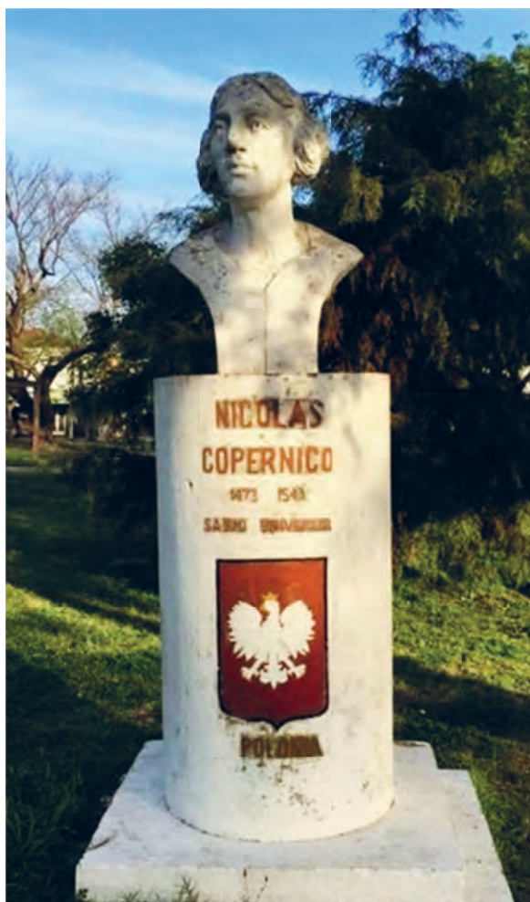
7. Popiersie Mikołaja Kopernika, Buenos Aires, 1973, Argentyna