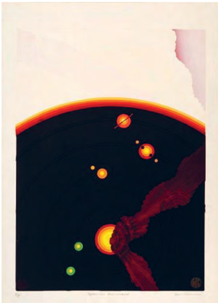
1. Leon Piesowocki, Copernican Roundbout , serigrafia kolorowa, 1971