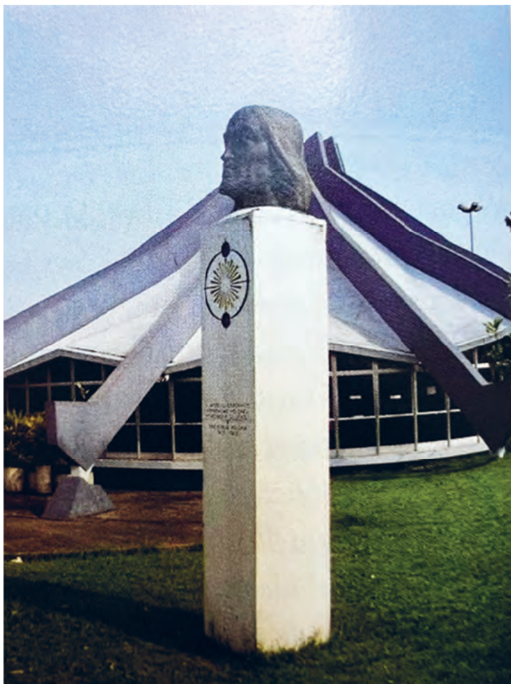
8.. Rzeźbiarski portret Mikołaja Kopernika, Porto Alegre, 1973, Brazylia