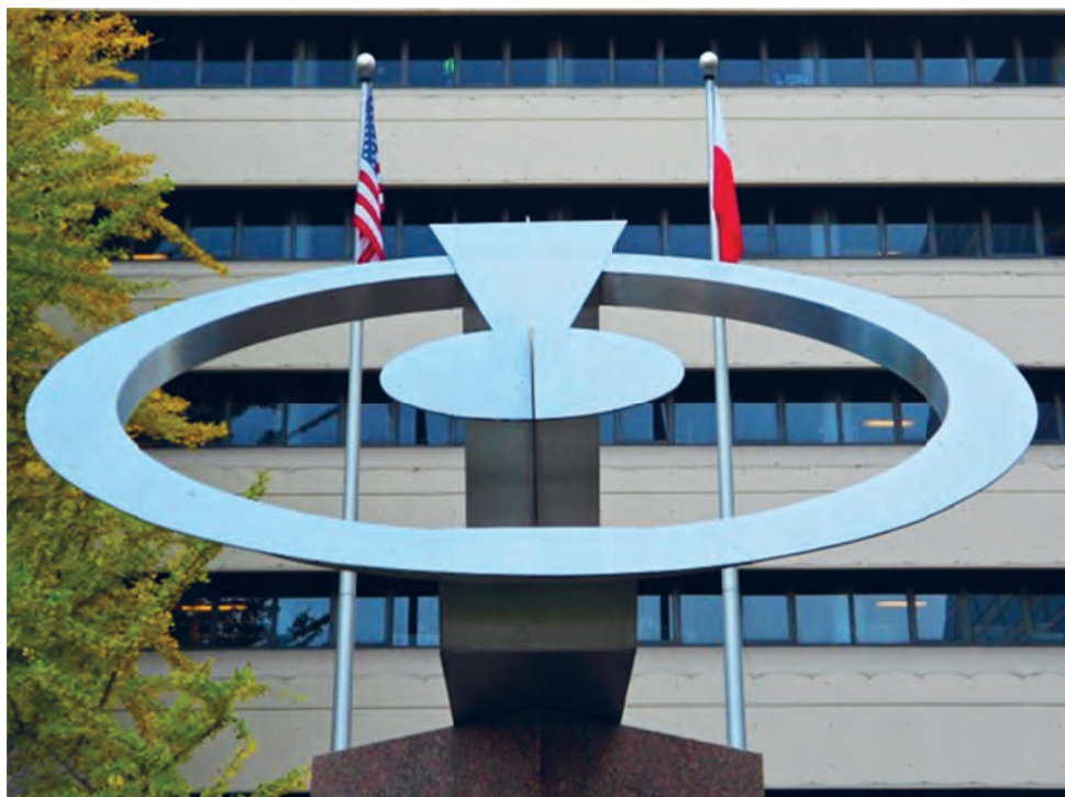
9. Rzeźba pt. Kopernik , autor Dudley Talcott, 1973, Filadelfia, USA