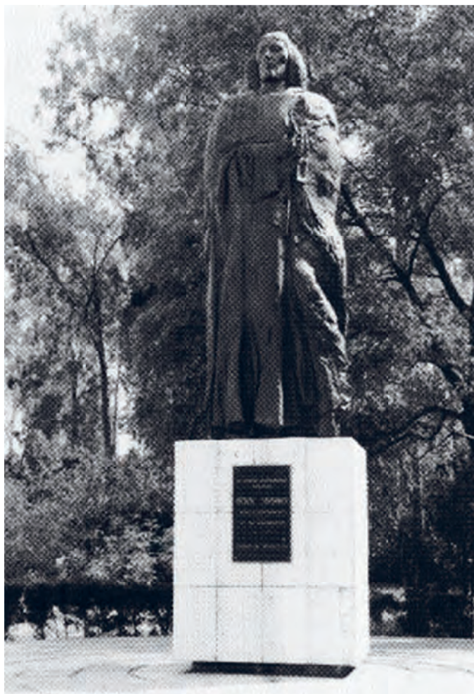
6. Pomnik Kopernika, autor — Mieczysław Welter, Ciudad de México, 1973, Meksyk