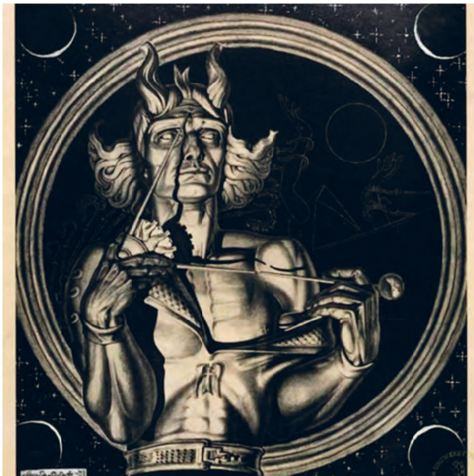
2. Stanisław Szukalski, Kopernik , grafika, 1970